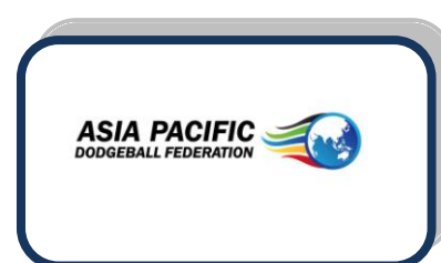
فدراسیون داژبال آسیا