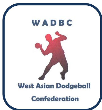
کنفدراسیون داژبال غرب آسیا