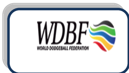
فدراسیون جهانی داژبال