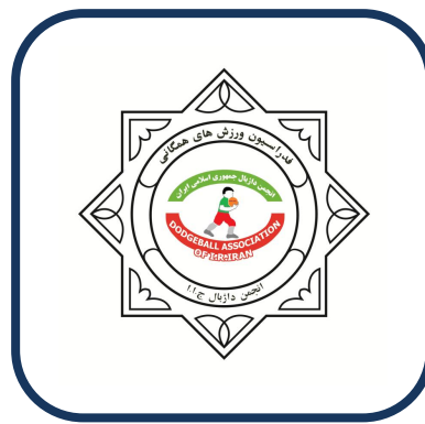
انجمن داژبال جمهوری اسلامی ایران