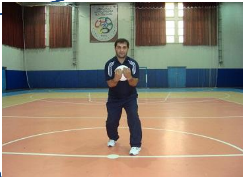
DODGEBALL SPORT ( VASATI STYLE )

۱۸- میزان نور در هنگام برگزاری مسابقات در زمین ساحلی و چمن نباید موجب اذیت و مصدومیت بازیکنان و عوامل اجرایی گردد ( هنگام برگزاری مسابقات در شب ، نور موجود در زمین مسابقات می بایست حدود ۲۰۰۰ لوکس باشد ).